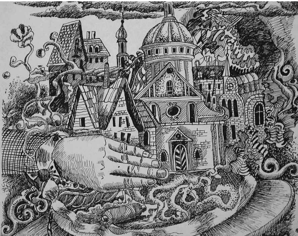
Работа стипендиатки конкурса «Ренессанс милосердия»